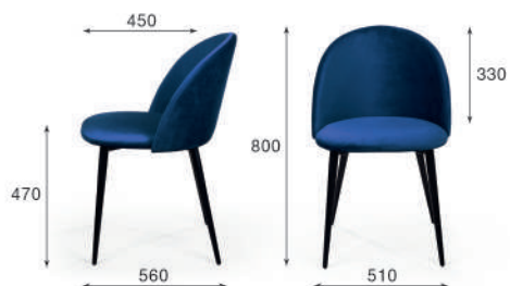
Стул обеденный Thomas