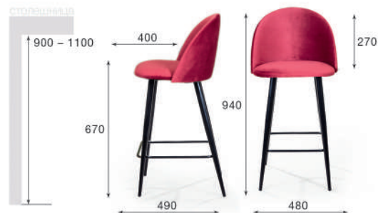
Стул полубарный Thomas