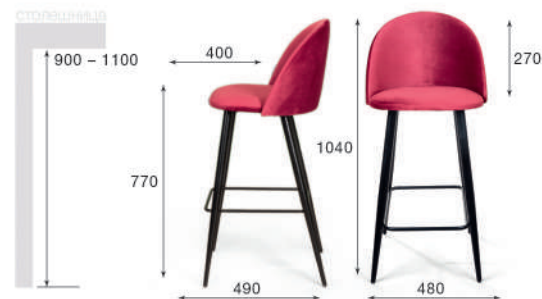
Стул барный Thomas