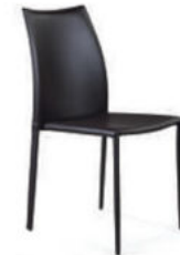
Стул Rolf, кожа коричневый

Актуальная информация о наличии на сайте top-concept.ru