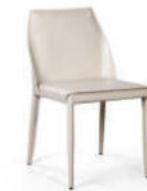
Стул Martin, кожа бежевый