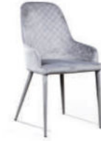
Стул Douglas, бархат серый