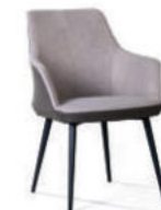
Стул Frank, рогожка комби бежевый

Актуальная информация о наличии на сайте top-concept.ru