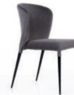
Стул Albert, бархат антрацит