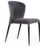
Стул Albert, бархат антрацит